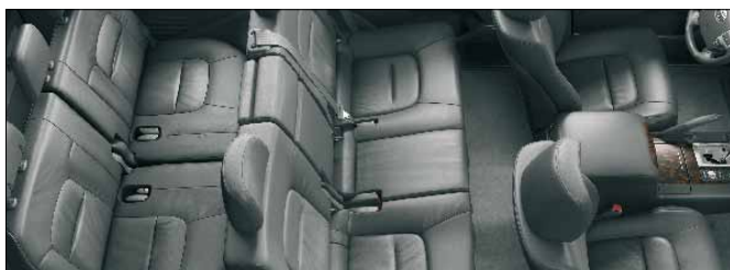
Trzeci rząd siedzeń