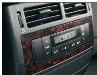
Czterostrefowa klimatyzacja automatyczna

W skład pakietu „Voyage“ wchodzi trzeci rząd siedzeń (brak rolety bagażnika) oraz dodatkowe wyposażenie podnoszące komfort pasażerów z tylnych rzędów siedzeń.