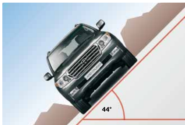
Maksymalny przechył boczny 44°