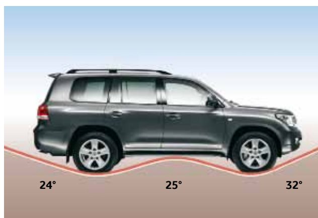
Kąt natarcia 32°, kąt zejścia 24° i kąt rampowy 25°