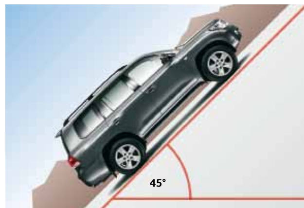
Zdolność pokonywania wzniesień 45°